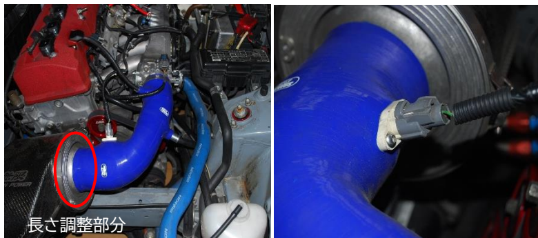
無限エアクリナー装着車