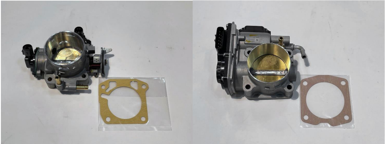
品番:AP1 ASM-AP100198 / AP2 ASM-AP100199

製品の装着、使用、およびメンテナンスが正しく行われない場合、いかなる事故があらましても、当社は一切の責任を負いかねますので、ご了承下さい。尚、製品の取り付けに関してご不明な点がございましたら、ASMまでお問い合わせ下さい。